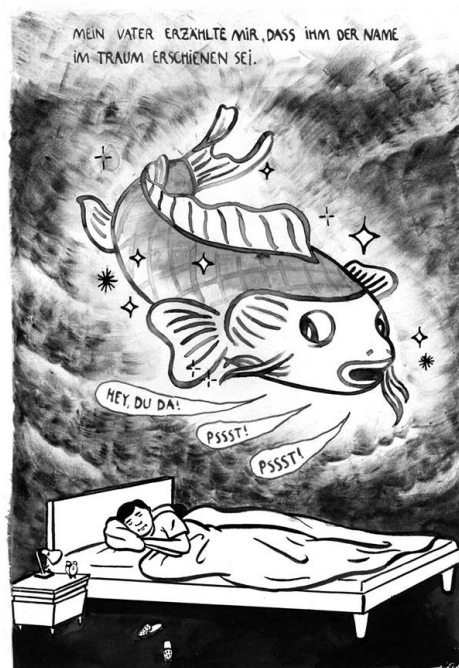
Bilder: Homestories, © Tine Fetz/Patu/Vina Yun

Das Set (2 Hefte und Poster) kostet 20€ und kann unter homestoriesvienna@gmail.com bestellt werden. Es ist aber auch in der Buchhandlung ChickLit (1010 Wien, Kleeblattgasse 7) erwerbbar.